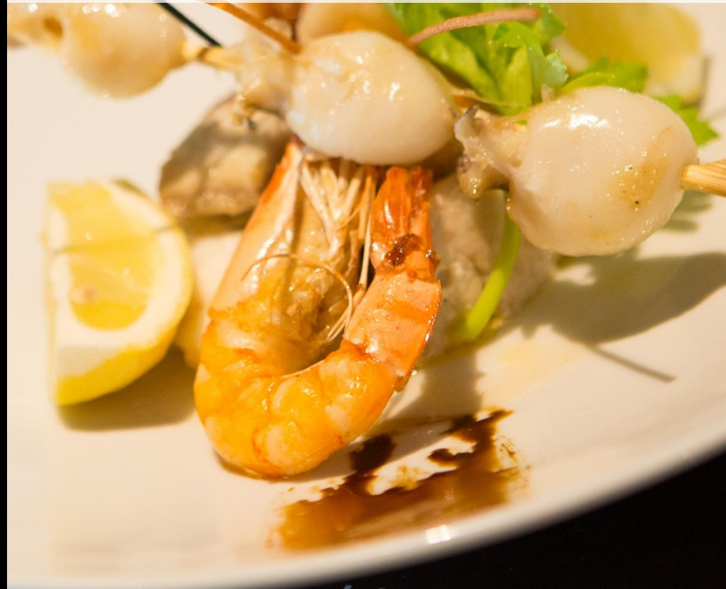
TABLE ! LA MISE... EN BO

Les menus sont susceptibles d'être modifiés en fonction des saisons.