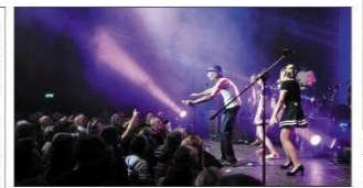
Le mythique groupe Raoul Petite a embarqué la foule dans son si sympathique délire scénique pour cette soirée solidaire et caritative.

C'est une édition qui restera dans toutes les mémoires, autant pour son record de fréquentation, avec plus de six cents festivaliers, que pour l'énergie incroyable qui se dégageait de la scène de Joa, samedi soir. Une programmation de folie, avec en tête de gondole, l'extraordinaire découverte de la soirée, Quintana Dead Blues Expérience et son One man rock'n'roll Electro Heavy Blues détonnant. Suivi du King Raoul Petite, et son arrivée triomphante traversant la foule, perché sur son trône, avant d'enflammer la salle avec ses textes et ses scénographies hilarantes. Puis, en clôture de la plus grande soirée caritative de l'année, cinq lascars locaux, La Ruelles des Mômes, du rock dynamique et festif de boulevard, ou l'accroché et la trompette mènent le tempo. Du son, de la bonne humeur et des centaines de jouets destinés aux associations variées, qui œuvrent pour l'enfance et les familles dans le bassin. Cha-